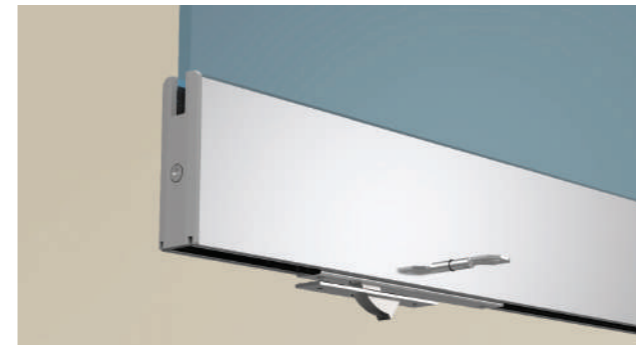
Riegel am Unterrahmen